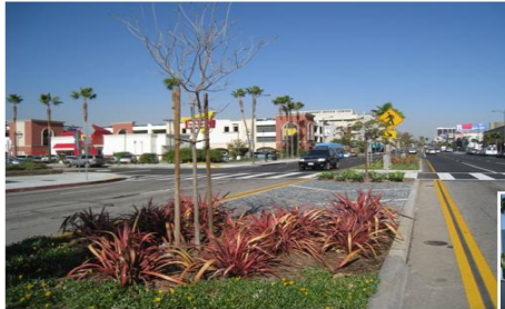
Sepulveda from Howard Hughes to Lincoln